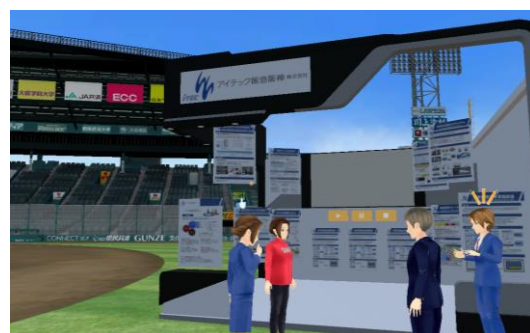
来場者アバターの目線のイメージ

出展者も来場者も、オンラインゲームのようにアバターを通じてご参加いただけます。アバターは、ゲーム感覚で簡単に操作することができ、会場内を自由に歩き回っていただけます。また、出展ブースに設置されている映像や資料の閲覧、さらには双方向の音声通話が可能で、実際の展示会に近い形で商談を行っていただけます。