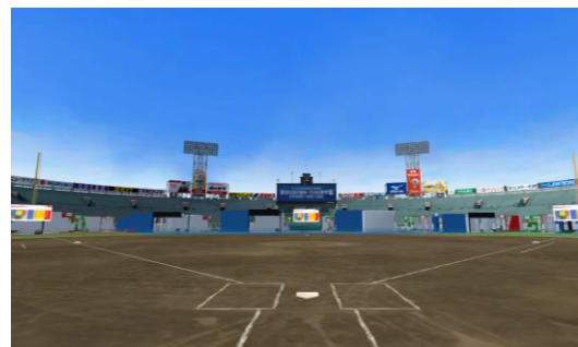
デジタル甲子園のイメージ

① 展示会の舞台はデジタル空間に誕生した阪神甲子園球場 阪神タイガースの本拠地として知られる阪神甲子園球場を、デジタル空間にCGで忠実に再現しました。普段は立ち入ることができないグラウンド内を実際に歩いているような臨場感を体感することができます。また、デジタル空間の展示会ですので、遠方の方や出張制限がある方にもご参加いただけます。